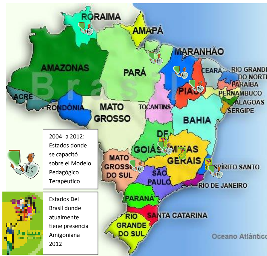
Mapa Político del Brasil con las presencias amigonianas actuales.