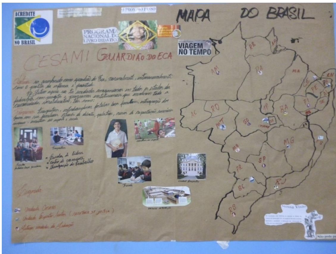
Elaborado por lós funcionários de CESAMI

La proyección de los Amigonianos y su visión de Futuro es la de ser referencia nacional en la implementación del Modelo Pedagógico Terapéutico Amigoniano como el Guardián del Estatuto de la Crianza (Niñez) y el Adolescente - ECA, en todo el país y atender también otras problemáticas como son atención a dependientes químicos.